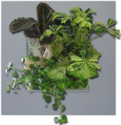
Tailles SMALL 31x31cm