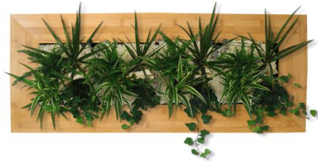
Tailles SMALL 31x31cm