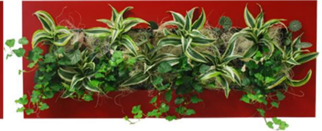
Tailles SMALL 31x31cm