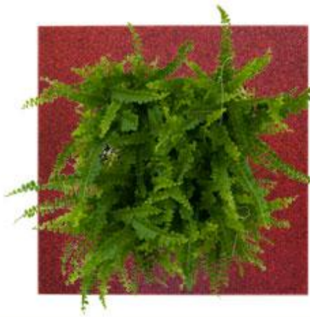
Tailles SMALL 31x31cm